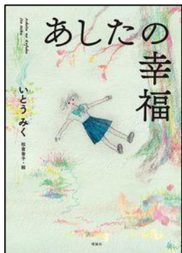
『あしたの幸福』 いとうみく／著 理論社